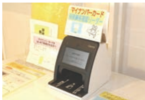
顔認証付きカードリーダー