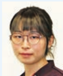
おけや あおば 桶屋 青葉