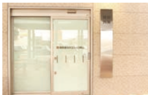
発熱外来専用出入口