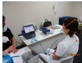
個人防護具の着脱 (N95マスクフィットテスト)