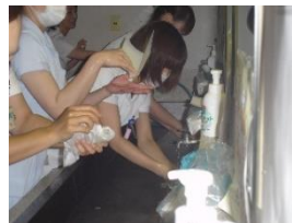
手指衛生の方法やタイミング